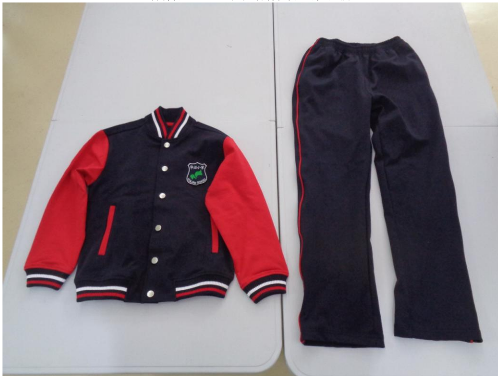
藏青/红色上衣；藏青嵌红条长裤