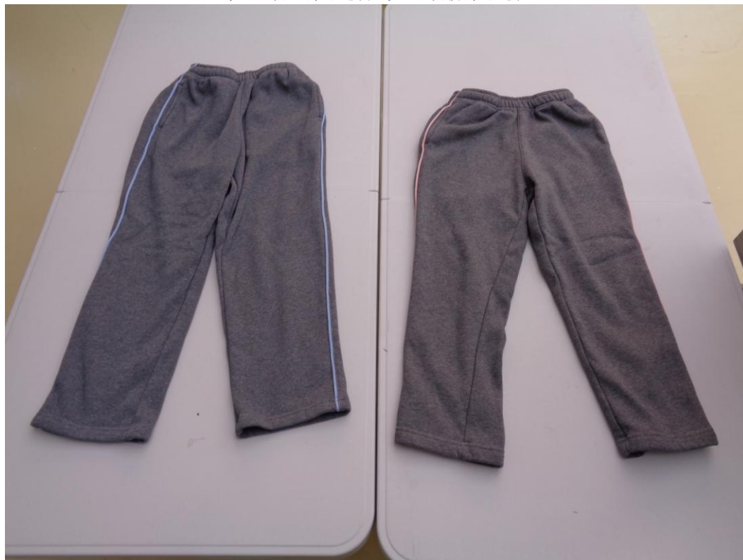
灰色嵌蓝条长裤；灰色嵌粉条长裤