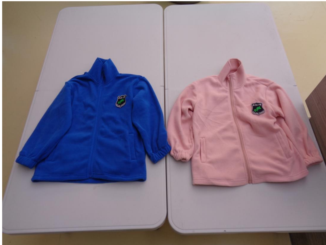
蓝色内胆衣；粉色内胆衣