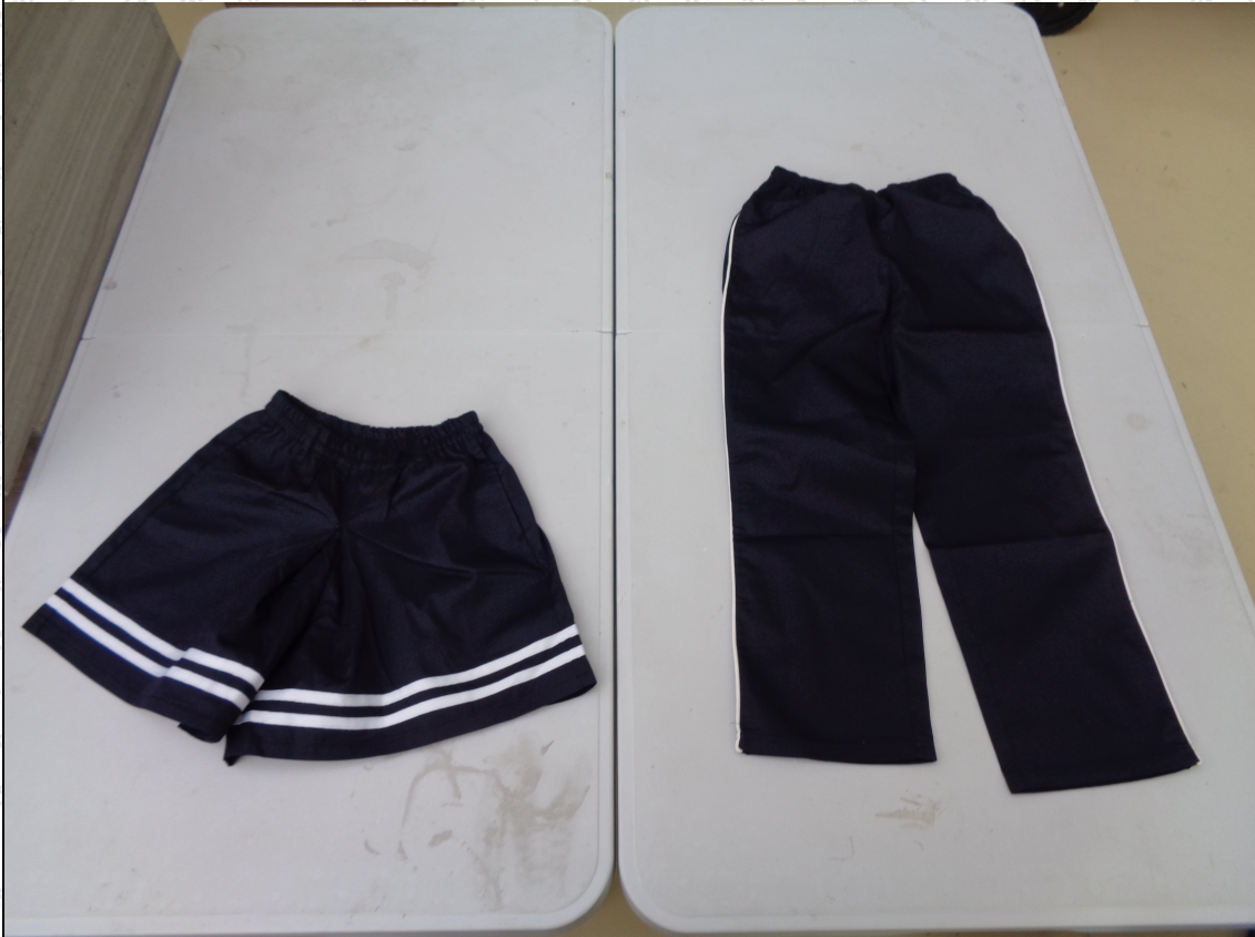
藏青色短裙；藏青色长裤