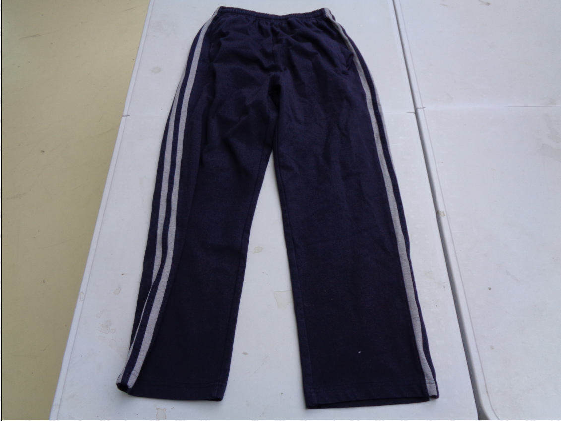
藏青色嵌灰条长裤