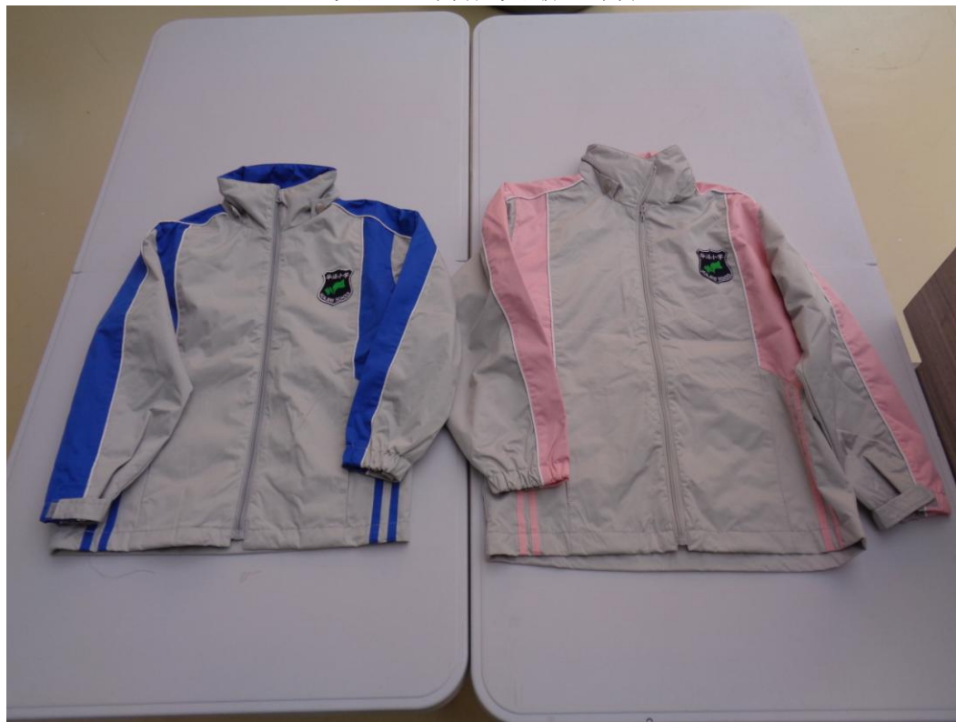
灰/蓝色外套；灰/粉色外套